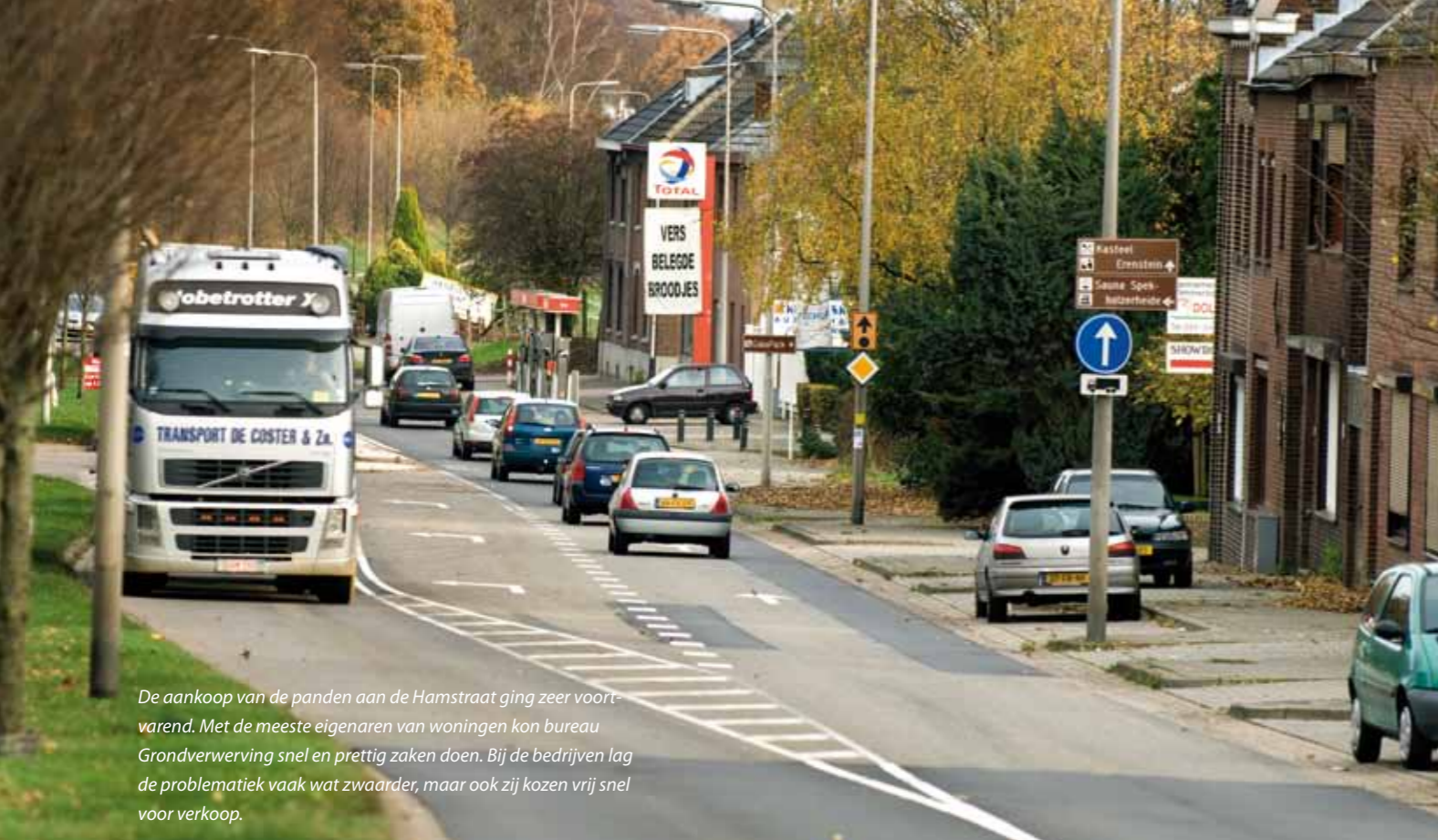
De aankoop van de panden aan de Hamstraat ging zeer voortvarend. Met de meeste eigenaren van woningen kon bureau Grondvererving snel en prettig zaken doen. Bij de bedrijven lag de problematiek vaak wat zwaarder, maar ook zij kozen vrij snel voor verkoop.