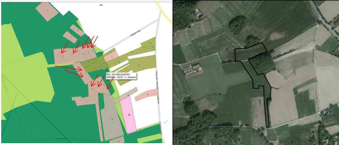
Locatie vervangende natuurcompensatiegronden Schinnen

Hoewel formeel niet nodig (zie boven) heeft de provincie Limburg toch vervangende compensatiegrond gezocht, gevonden en aangewezen. Het betreft gronden in Schinnen (zie onderstaande figuur). De percelen hebben een totale oppervlakte van 1,9 hectare. De Provincie heeft deze gronden inmiddels in eigendom verworven.